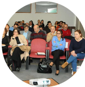
Sessão de abertura dos trabalhos 22/11/2017