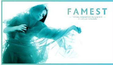
Logotipo e Imagem projeto