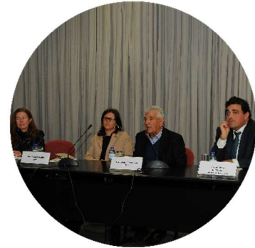
Sessão de abertura dos trabalhos 22/11/2017