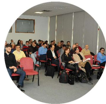
Sessão de abertura dos trabalhos 22/11/2017