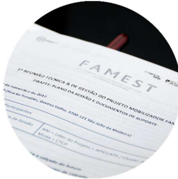
Sessão de abertura dos trabalhos 22/11/2017