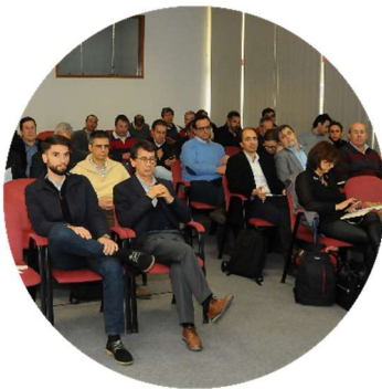
Sessão de abertura dos trabalhos 22/11/2017